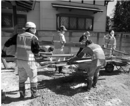
第2回 10月5日 18名参加