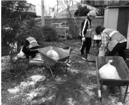
第1回 9月29日 14名参加

平成27年9月関東・東北豪雨の影響で被害に遭われた常総市の方々を支援するため、ご協力ありがとうございました。急な募集でしたが多くの市民ボランティアの皆様に参加いただきました。