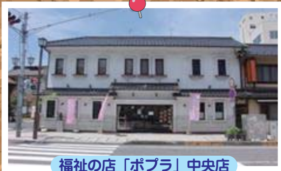
福祉の店「ポプラ」中央店

営業時間 月曜日から日曜日 9:00～18:00(年末年始休業) 住 所 土浦市大和町9-1ウララビル1階市民エリア 電 話 029-827-1130