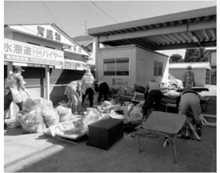
第3回 10月8日 11名参加