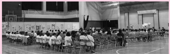
ボランティアのつどい

そして午後は、雪印メグミルク(株)阿見工場見学。徹底した衛生管理のもとに作られるチーズの自動化された製造工程の見学と試食、さすが日本の食品工場のすばらしさに感動するなど大変有意義な研修となりました。