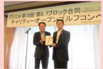
▲水戸信用金庫 第6・第7ブロック (車いす2台寄贈)